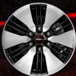
דגם LS PREMIUM