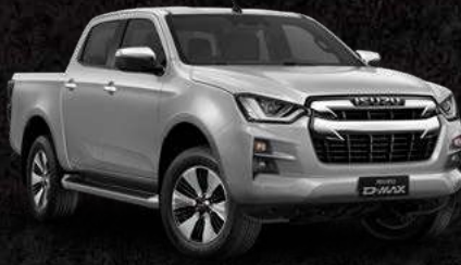
אפור בהיר מטאלי