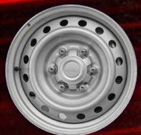
דגם S / S+