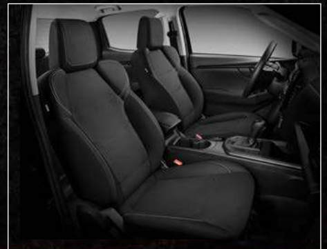
דגם S / S+ ריפודי בד בצבע שחור