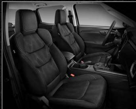
דגם LS+ ריפודי בד בצבע שחור