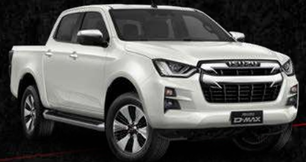
לבן פנינה *בתוספת תשלום