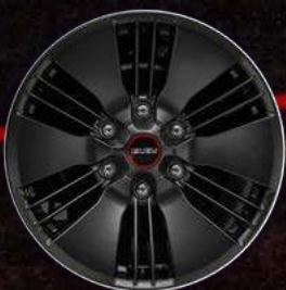
דגם LSE PREMIUM