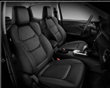
דגמי LS / LSE PREMIUM ריפודי עור בצבע שחור